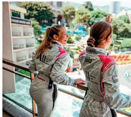
Des places pour assister à l'e-prix de Formule E à Monaco sont offertes par Accor dans une logique de valorisation des meilleurs clients.

« À noter enfin que les SVI lors d'un appel téléphonique seront aussi progressivement remplacés par des callbots pour réserver de bout en bout un séjour ou un transport