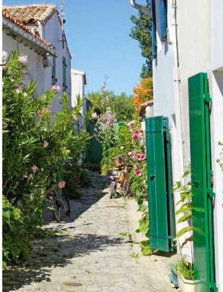
Les rues fleuries des villages de l'île de Ré.