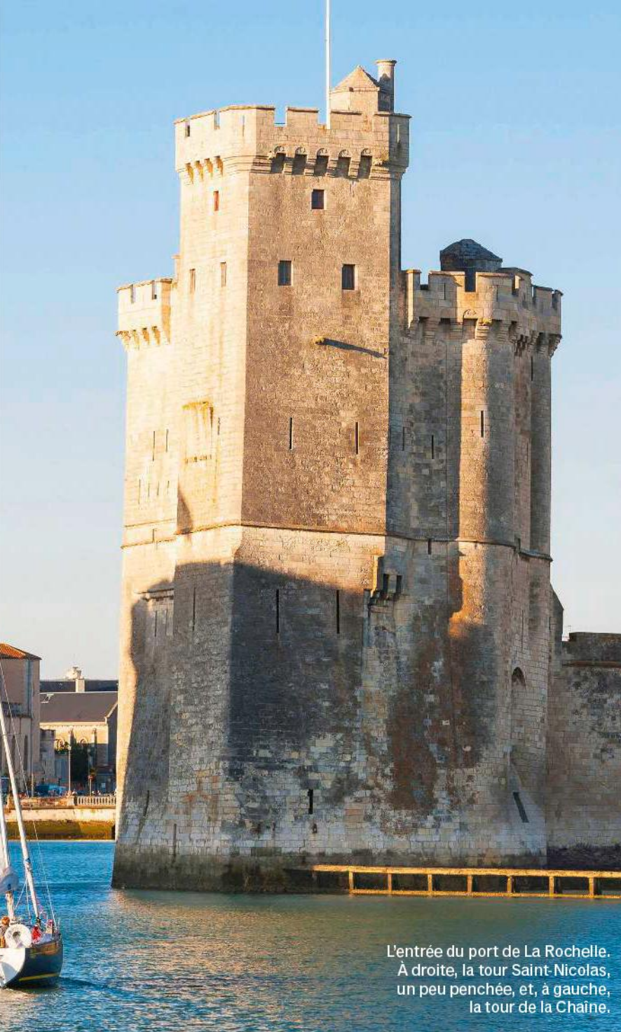
L'entrée du port de La Rochelle. À droite, la tour Saint-Nicolas, un peu penchée, et, à gauche, la tour de la Chaîne.