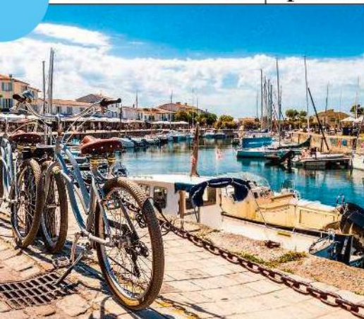
Le port pittoresque de Saint-Martin-de-Ré.